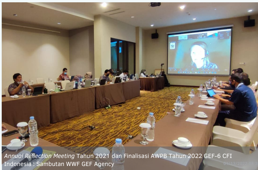
Annual Reflection Meeting Tahun 2021 dan Finalisasi AWPB Tahun 2022 GEF-6 CFI Indonesia : Sambutan WWF GEF Agency